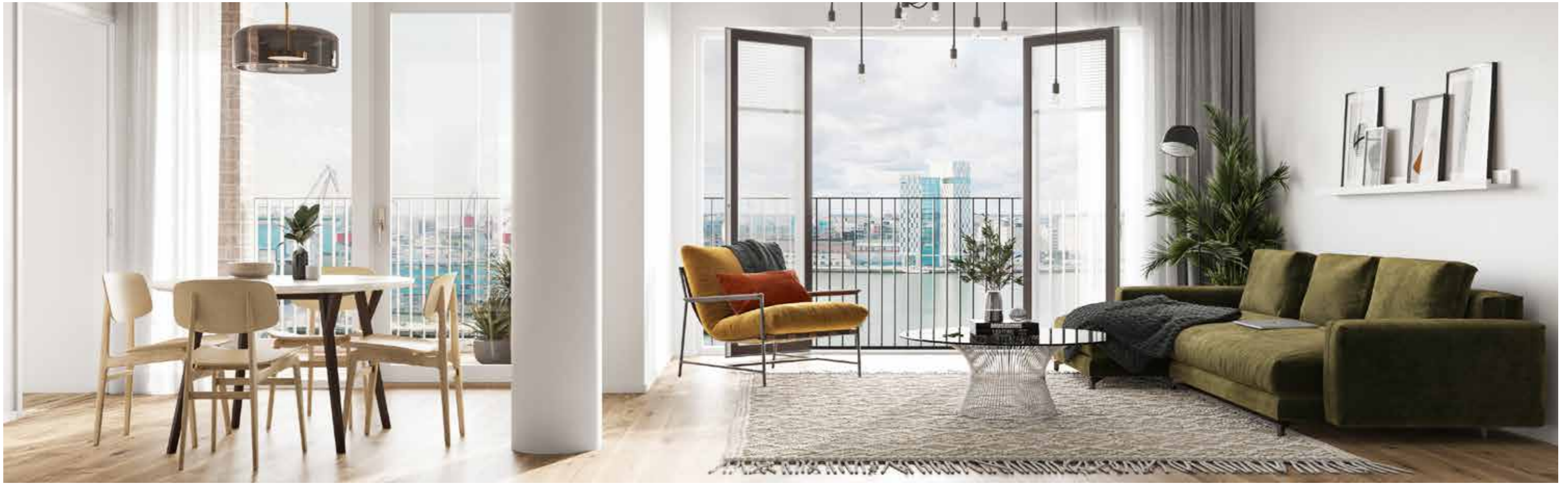
Asuntojen sisustuksissa on käytetty ajattomia väri- ja materiaalivaihtoehtoja.