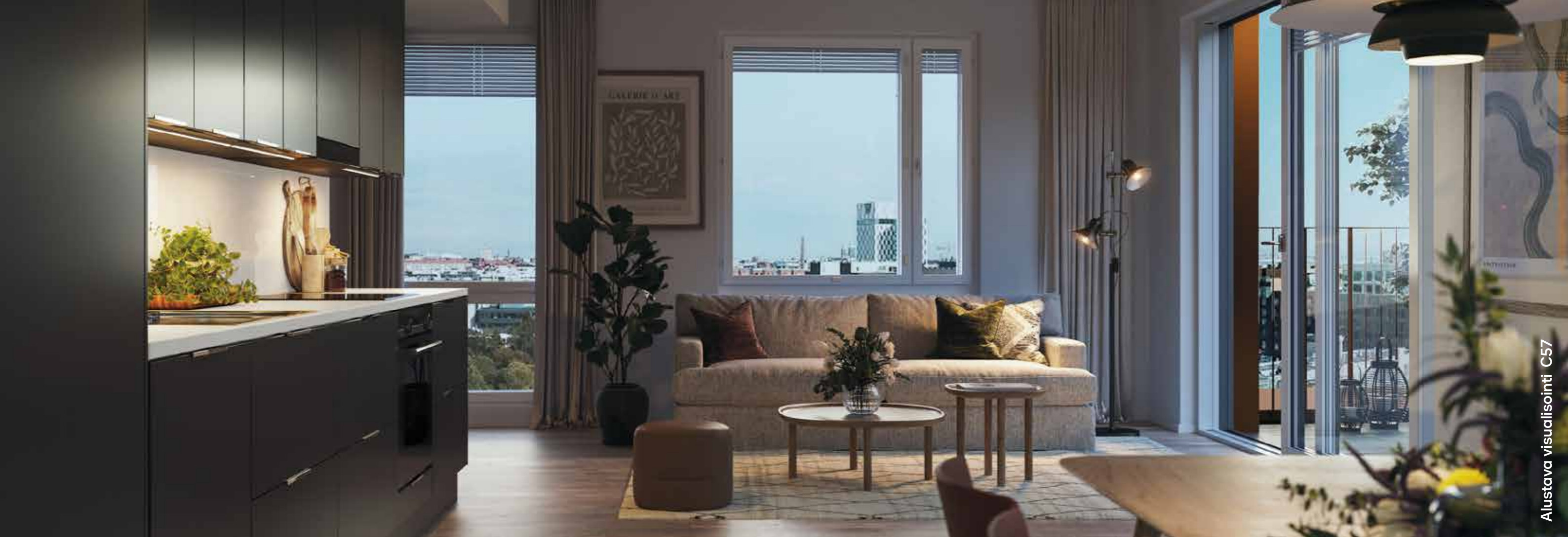
Alustava visualisointi C57