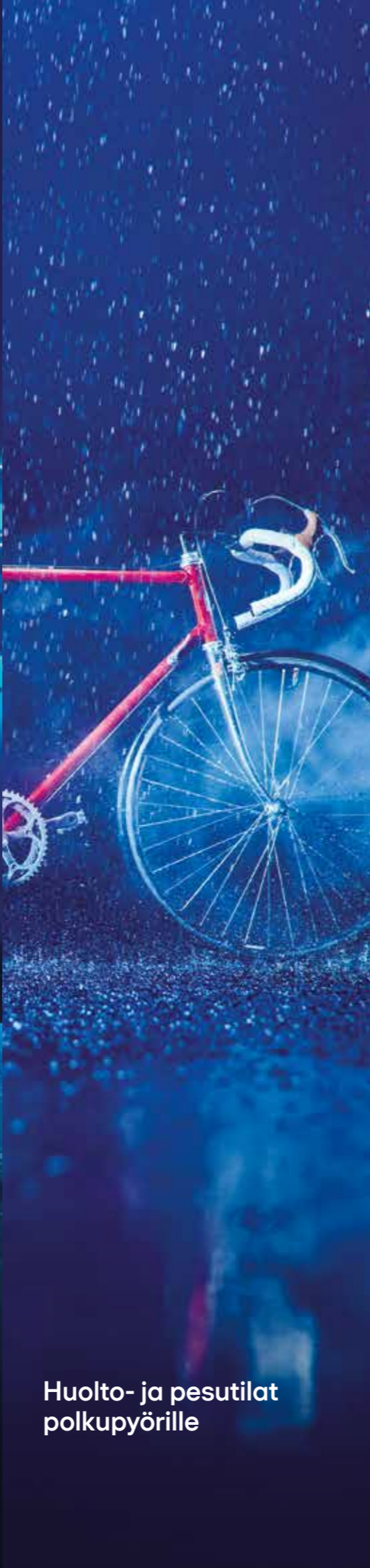
Huolto- ja pesutilat polkupyörille