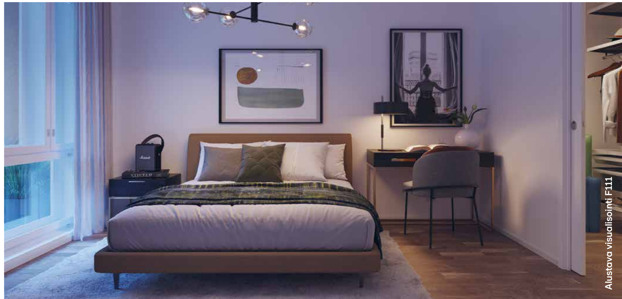
Alustava visualisointi F111