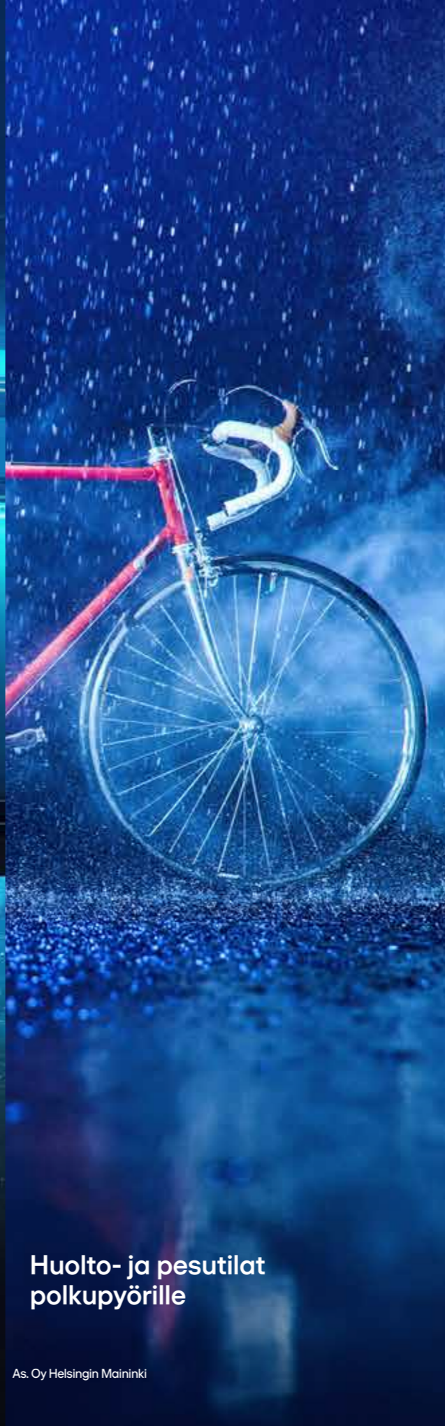
Huolto- ja pesutilat polkupyörille