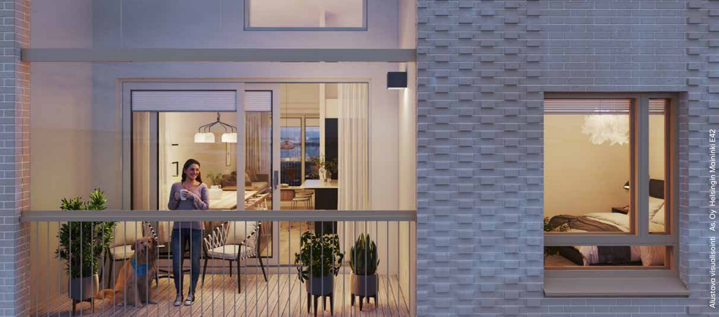
Alustava visualisointi As. Oy Helsingin Maininki E42